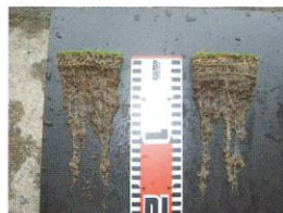
【茨城県Dゴルフクラブ】 実施時期4月~6月(3ヵ月後) 投下量 1.5cc(月)