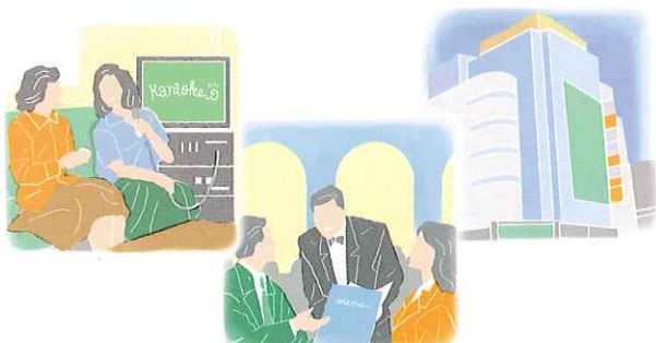
レストランの厨房に

工場排気、厨房排気、ゴミ処理施設、下水処理施設、排水処理施設 環境庁大気保全局の調査(1998)によると、悪臭への苦情は、近隣と密接した都市型生活の広がりとともに増加傾向にあります。このように、現在は低濃度の悪臭であってもクレームになりやすい状況ですので、早めの環境対策を心がけましょう。