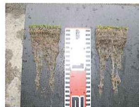
【茨城県Dゴルフクラブ】 実施時期4月~6月(3ヵ月後) 投下量 1.5cc(月)