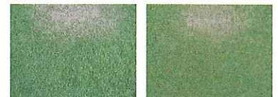
(写真左) 腐植元KELP処理区 (写真右) 通常処理区

表面の状態はテスト区のほうが良くなっており、密度、葉幅の揃い方も上回る結果となっています。 また、茎の状態を見ると、対象区では寝ている茎が多いのに対してテスト区では立っている茎が多いことが見受けられます。 根の状態も根量でテスト区は対象区を上回る結果が出ました。