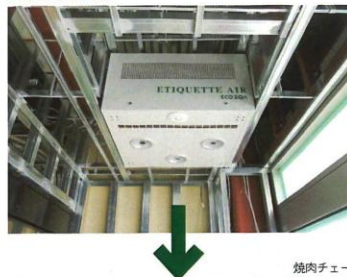
焼肉チェーン店風除室設置例